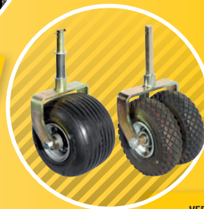
4 VERSCHIEDENE RÄDER DIFFERENT WHEELS VOLITELNÁ OPĚRNÁ KOLA