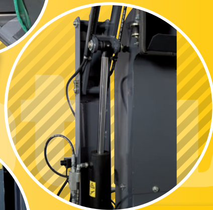
2 DOPPELT WIRKENDER ZYLINDER DOUBLE-ACTING CYLINDER DVOUČINNÝ HLAVNÍ HYDROMOTOR