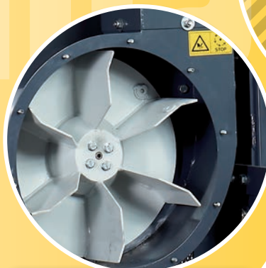
3 OPTIMIERTER FLÜGEL OPTIMIZED TURBINE OPTIMALIZOVANÝ TVAR LOPATEK