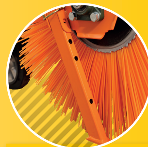
4 SEITENLAGERUNG + ABSTELLSTÜTZE SIDE-BEARING + PARKING SUPPORT BOČNÍ LOŽISKO + PODPĚRA PRO Odstavení