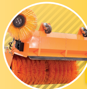
5 SEITENBESEN + SCHMUTZBEHÄLTER SIDE BROOM + DIRT COLLECTOR STRANOVÝ KARTÁČ + VANA NA NEČISTOTY

Díky nízké náročnosti na údržbu je péče tyto stroje snadná a zaručuje jim stejnou spolehlivost, jakou se vyznačují všechny ostatní výrobky Matev. SWE – odolné nářadí v osvědčeném provedení. Kvalita Matev.