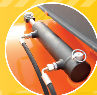
2 WINKELVERSTELL- UND BEHÄLTERLEERZYLINDER ANGULAR ADJUSTMENT – AND DUMP CYLINDER HYDROMOTOR PRO NASTAVENÍ ÚHLU ZAMETÁNÍ