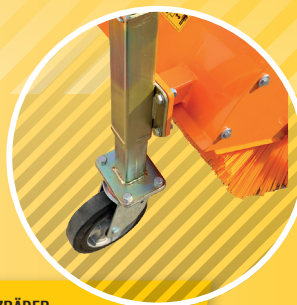
1 STÜTZRÄDER SUPPORT WHEELS KOPIROVACÍ KOLA

Der geringe Wartungsaufwand macht diese Geräte so pflegeleicht und zuverlässig wie alle matev-Produkte. SWE – langlebige Geräte in bewährter matev-Qualität.