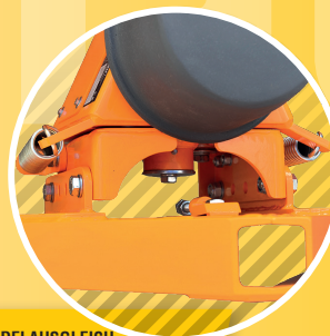
3 PENDELAUSGLEICH PENDULUM COMPENSATION VÝKYVNÉ ZAVĚŠENÍ

Low maintenance requirements make these implements as easy to care for and reliable as all matev products. SWE – robust implements in proven matev quality.