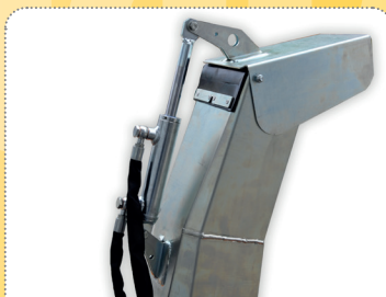
Nastavení koncovky lze ovládat hydraulicky nebo elektricky.

Skid plates included as standard of the snow blower