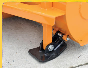
Do základní výbavy sněžové frézy patří kluzáky.

Skid plates included as standard of the snow blower