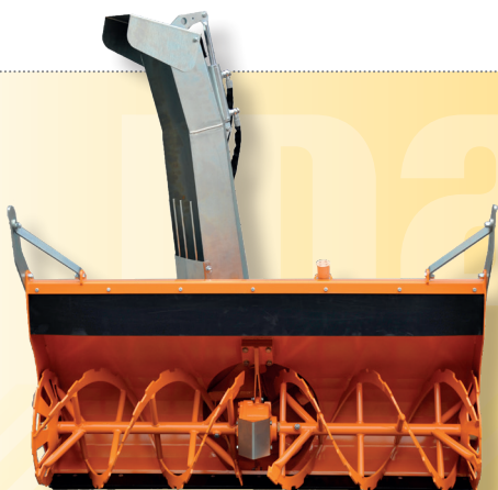
pracovní záběr 120 cm / 140 cm

The snow is ejected by the hydraulically rotating discharge chute. For an aimed ejection also the deflector is optionally adjustable hydraulically or electrically.