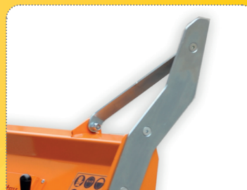
V závěších se osvědčí standardně dodávané boční nože (levý a pravý).

Deflector is optionally hydraulically or electrically adjustable