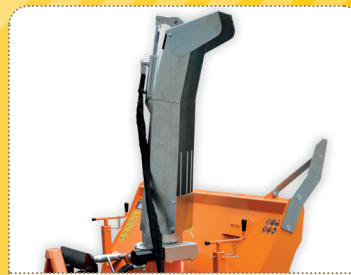
Přesný výhoz otočným, hydraulicky stavitelným komínem

Robust auger with 400 mm diameter and working width of 120 or 140 cm