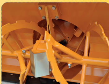
Metač s průměrem 380 mm